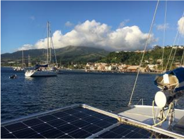
St. Pierre ankerbugt