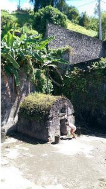
Isolationscellen hvor den eneste overlevende var.

Grundene til øens guvernør ikke vil lade byen evakuere var for det første frygten for, at plantageejerne og businessmændene i byen vil gå fallit og give ham skylden, hvis vulkanen ikke gik i udbrud, og for det andet var der valgperiode og den sorte del af befolkningen havde for første gang mulighed for at ændre den politiske situation i byen. Så ville han miste magten, hvis det ville vise sig at han løj.