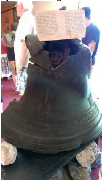
Næsten smeltet kirkeklokke

Byen blev langt i ruiner og ude i bugten blev 12 skibe, der lå for anker, tilintetgjort.