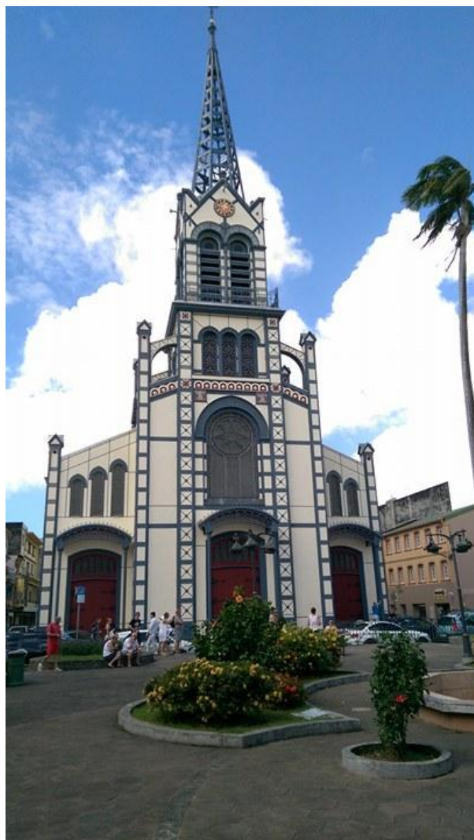
Katedralen i Fort France

Sådan gik det til, og nu hedder hovedstaden Fort de France og den ligger længere sydpå, langs den vestlige kyst. Martinique har et areal på 1.128 km 2 og 430.000 indbyggere. Det er en meget frodig ø og man kan godt forstå der kommer så mange, især franske, turister til øen. Når man kommer sejlen i egen båd, er det altid spændende at se, hvordan det går med indklareringen, hvordan er myndighederne og kan vi finde en god ankerplads. Men her på Martinique, skal man bare finde det kontor eller måske bar, hvor der står en pc klar til at