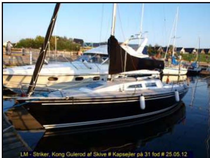
LM - Striker, Kong Gulerod af Skive # Kapsjeler på 31 fod # 25.05.12