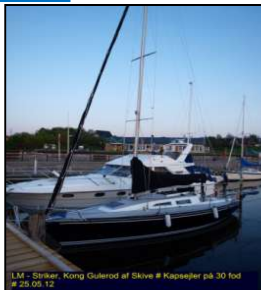
LM - Striker, Kong Gulerod af Skive # Kapsjeler på 30 fod # 25.05.12